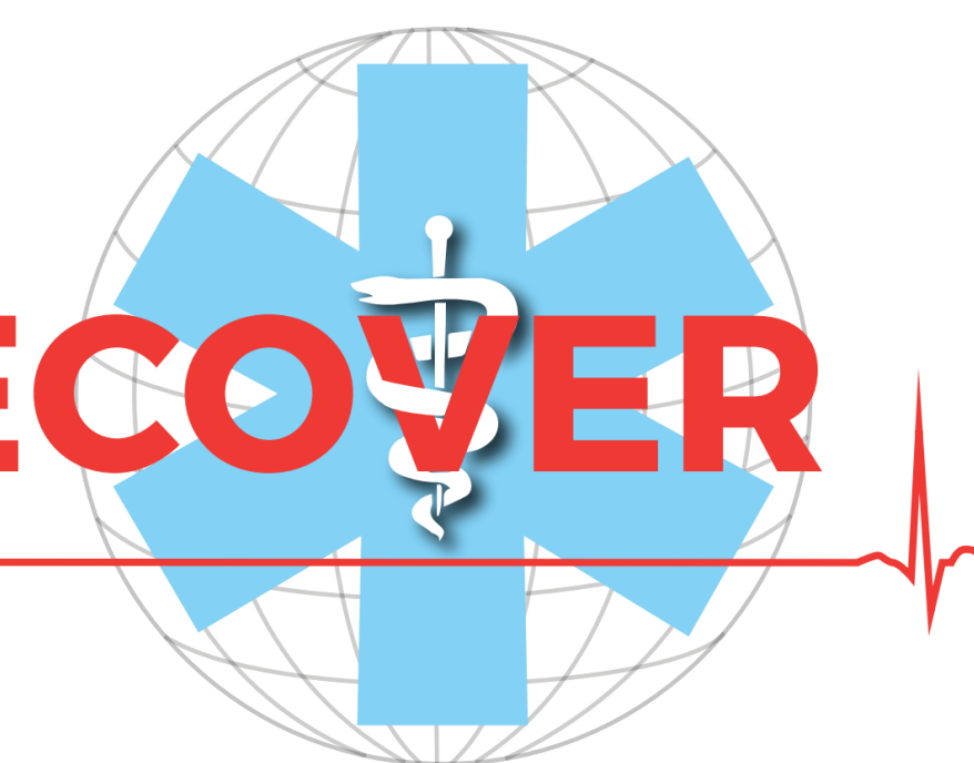
Tabella di dosaggio dei farmaci nella RCP nel cane e gatto RECOVER